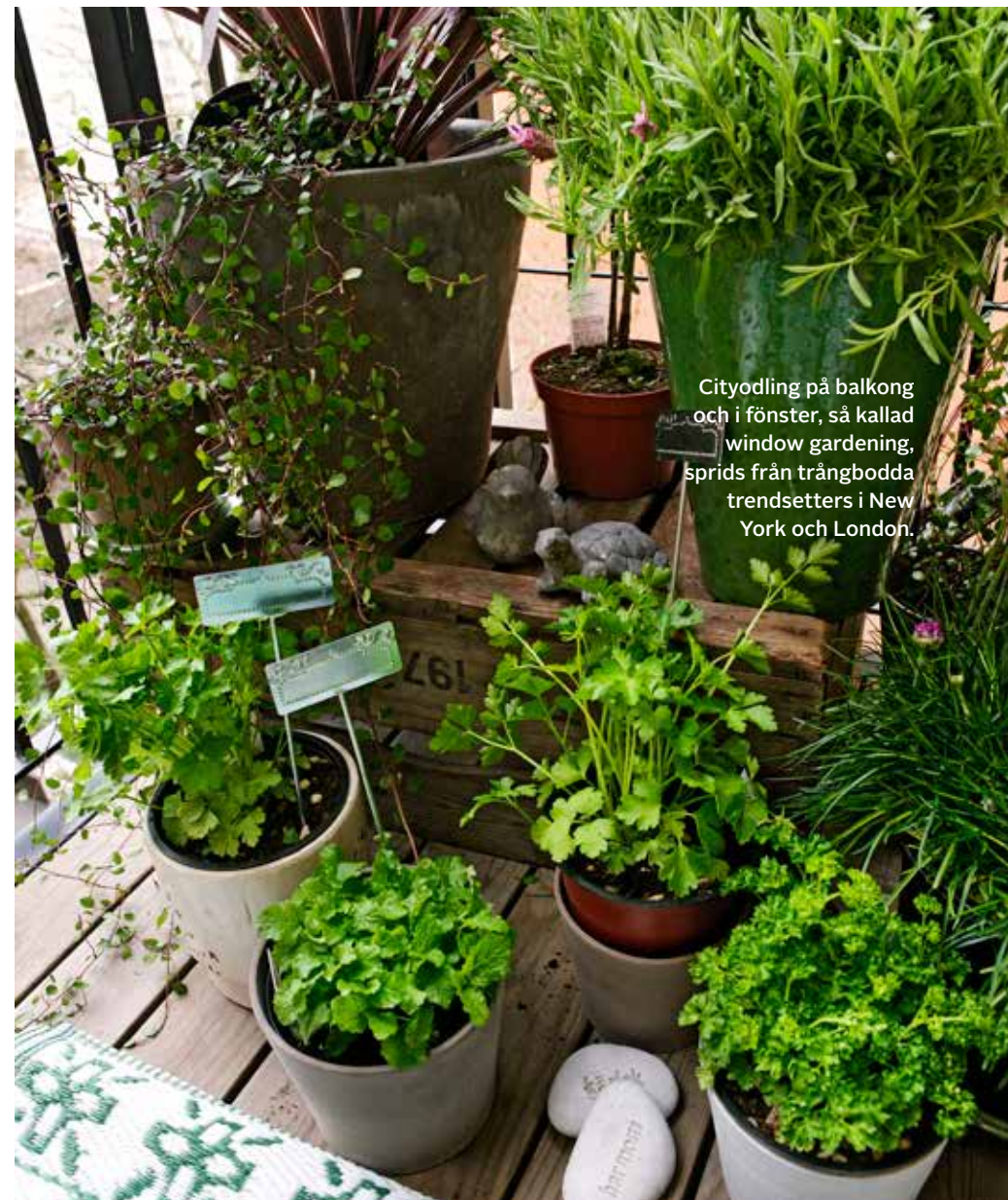
Cityodling på balkong och i fönster, så kallad window gardening, sprids från trångbudda trendsetters i New York och London.

”Många längtar efter det enkla och genuina”