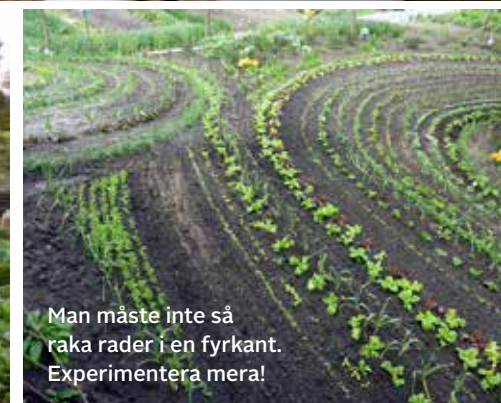
Man måste inte så raka rader i en fyrkant. Experimentera mera!