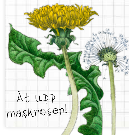
Ät upp maskrosen!

9 Använd ekologiska fröer, undvik genmanipulerade.