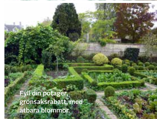
Fyll din potager, grönsaksrabatt, med ätbara blommor.