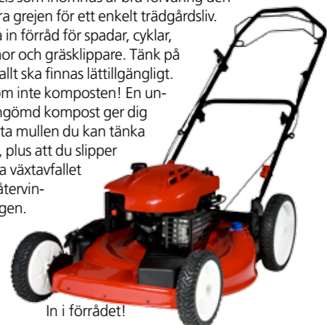
In i förrådet!

Precis som inomhus är bra förvaring den stora grejen för ett enkelt trädgårdsliv. Rita in förråd för spadar, cyklar, dynor och gräsklippare. Tänk på att allt ska finnas lättillgängligt. Glöm inte komposten! En undangömd kompost ger dig bästa mulden du kan tänka dig, plus att du slipper köra växtavfallet till återvinningen.