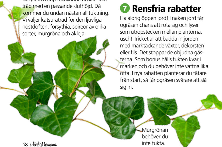
Murgrönan behöver du inte tukta.