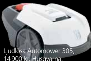
Ljudlösa Automower 305, 14900 kr, Husqvarna.

ROBOTGRÄSKLIPPARE. "Skaffa en robotgräsklippare. Gräsmattan är största tids-tjuven i trädgården. Roboten håller gräset i topptrim utan att du behöver lyfta ett finger."